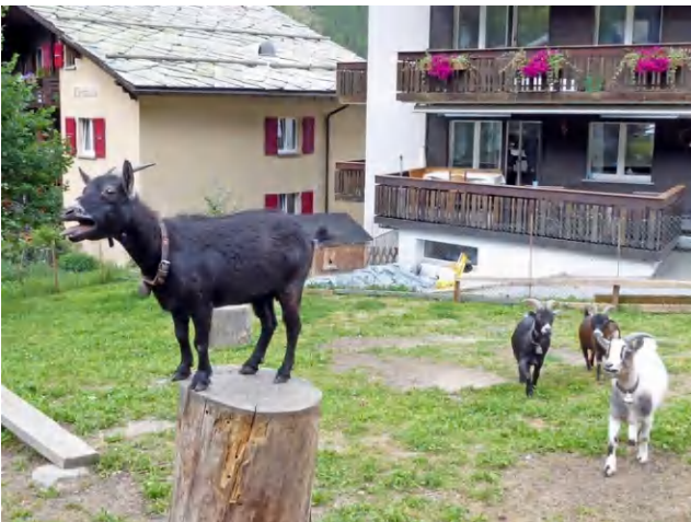
Begrüßung im Dorf