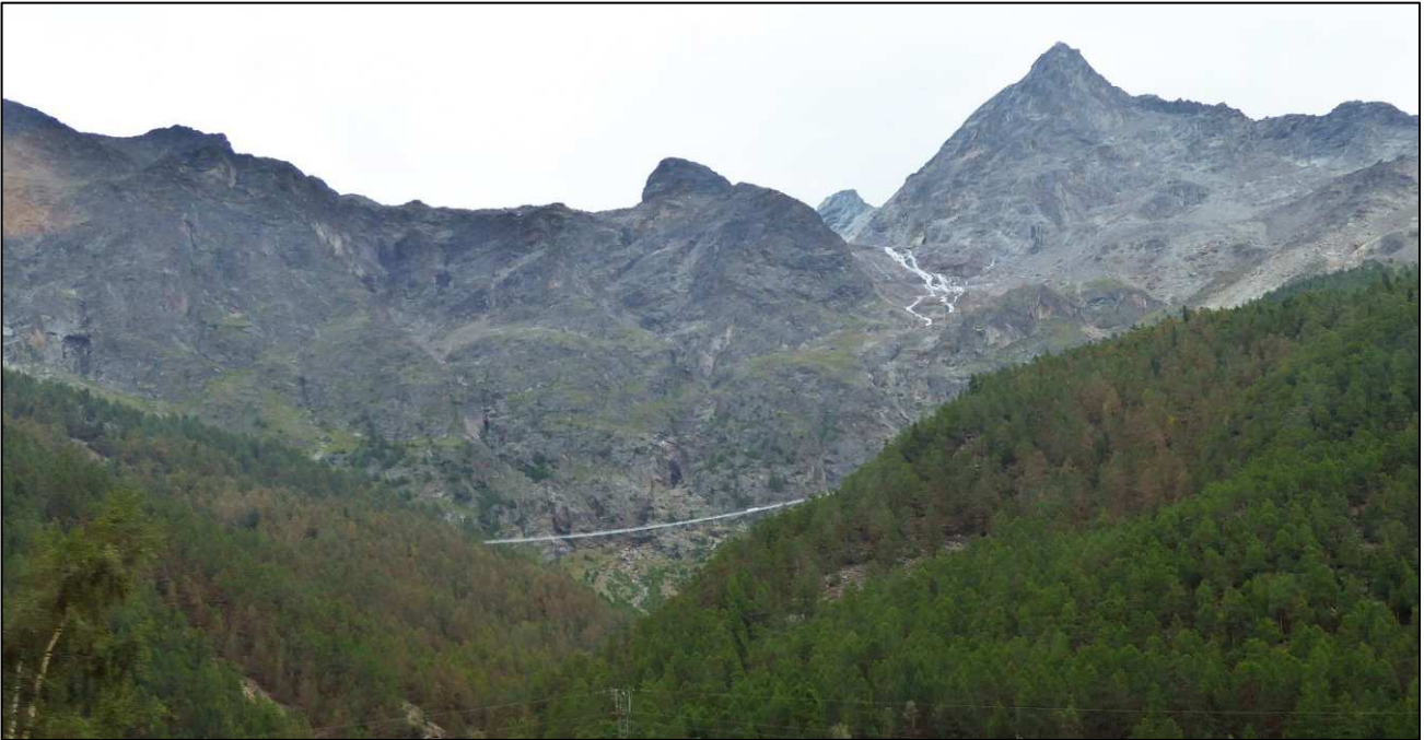
Die Brücke ist bereits aus dem fahrenden Zug sichtbar.