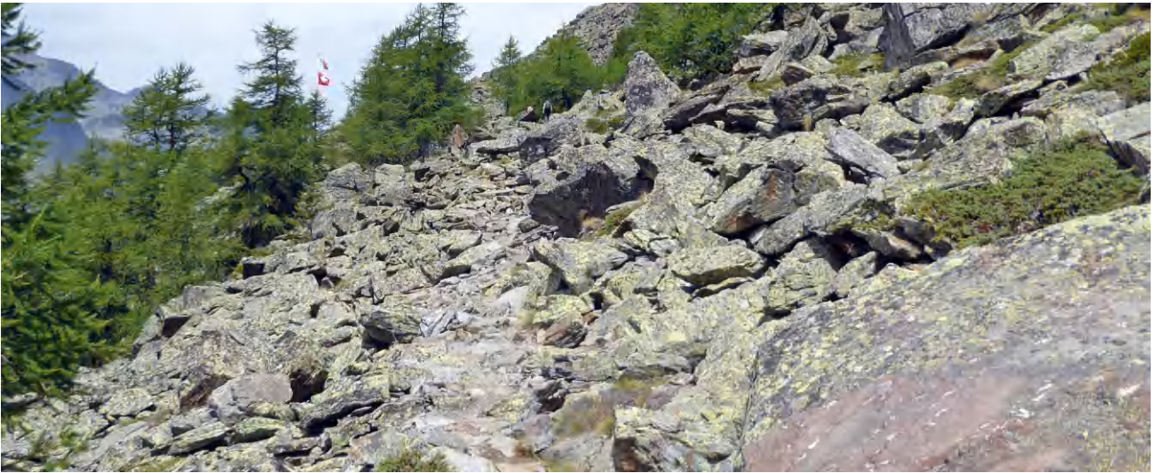
Fahne in Sicht