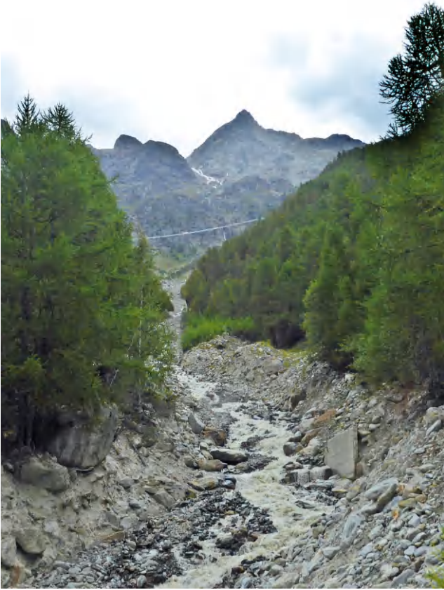
Brücke in Sicht