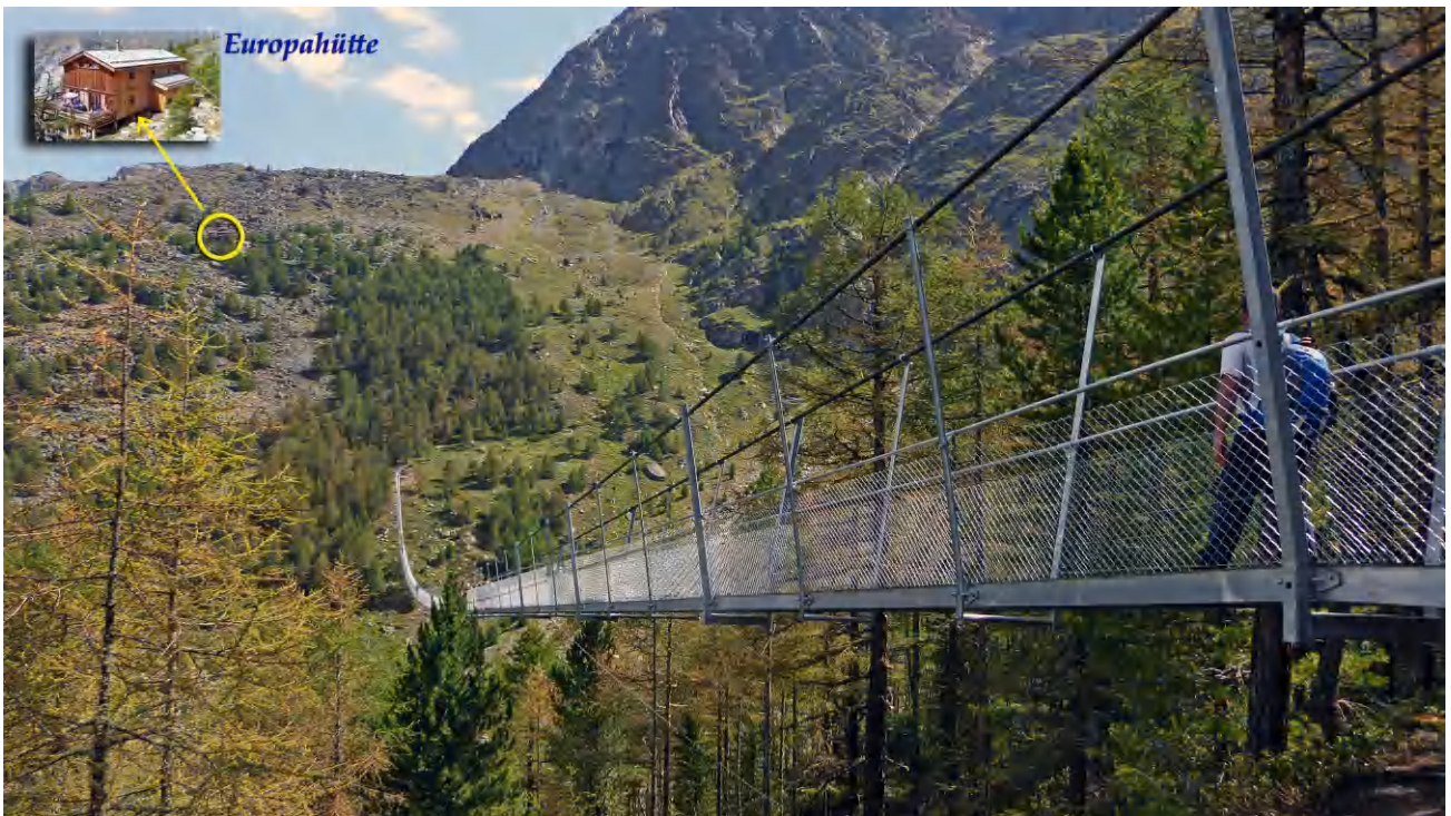
Europahütte in Sicht