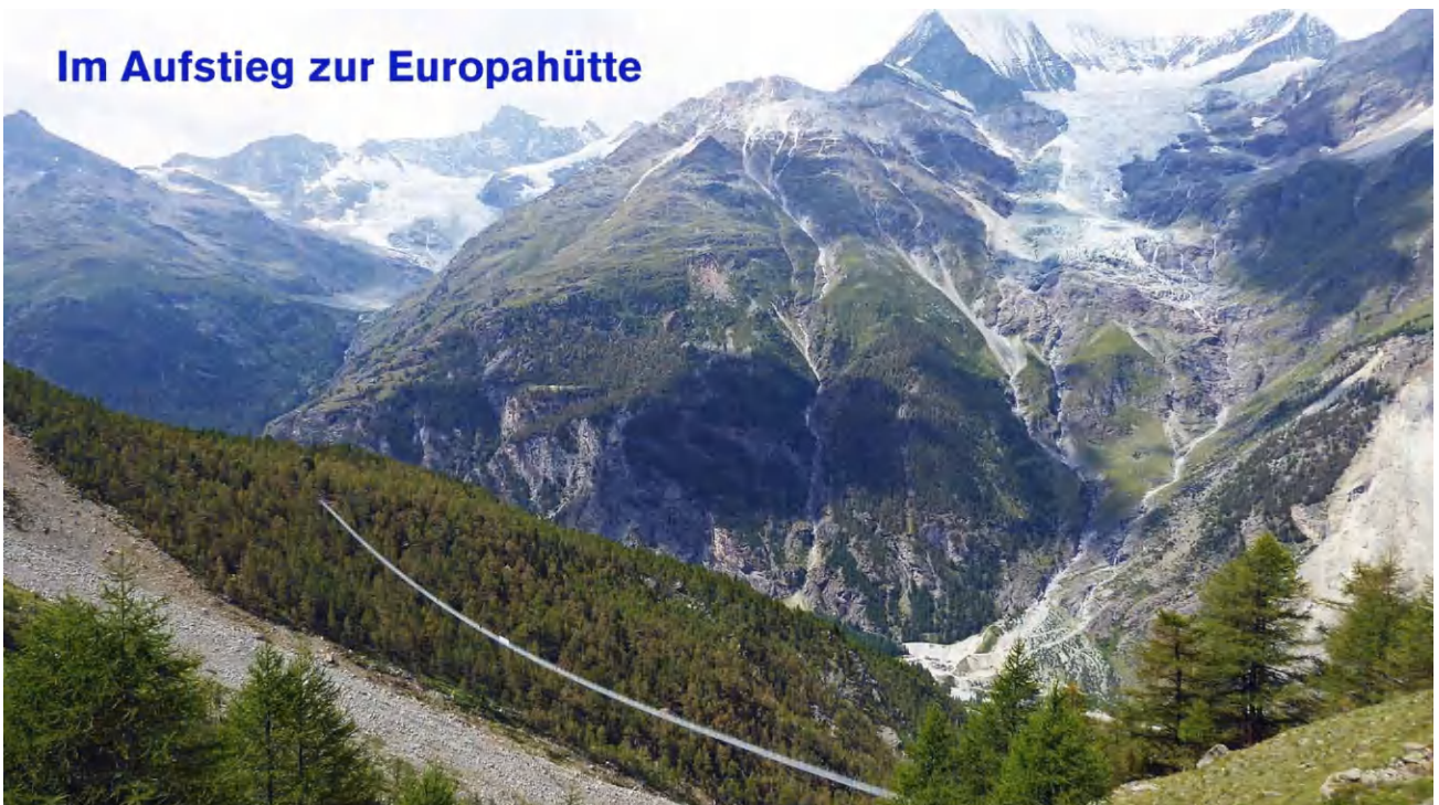
Im Aufstieg zur Europahütte