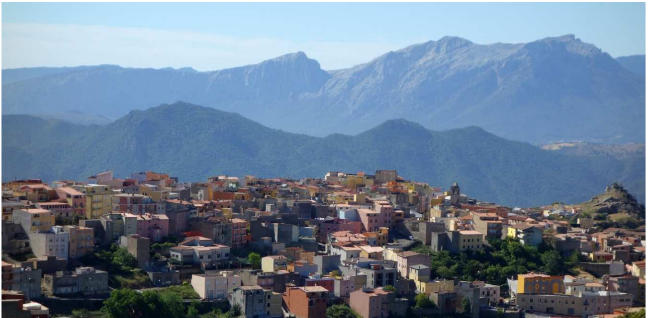
Orune Oliena am Morgen