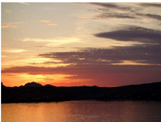
Auf der Fähre zurück aufs Festland