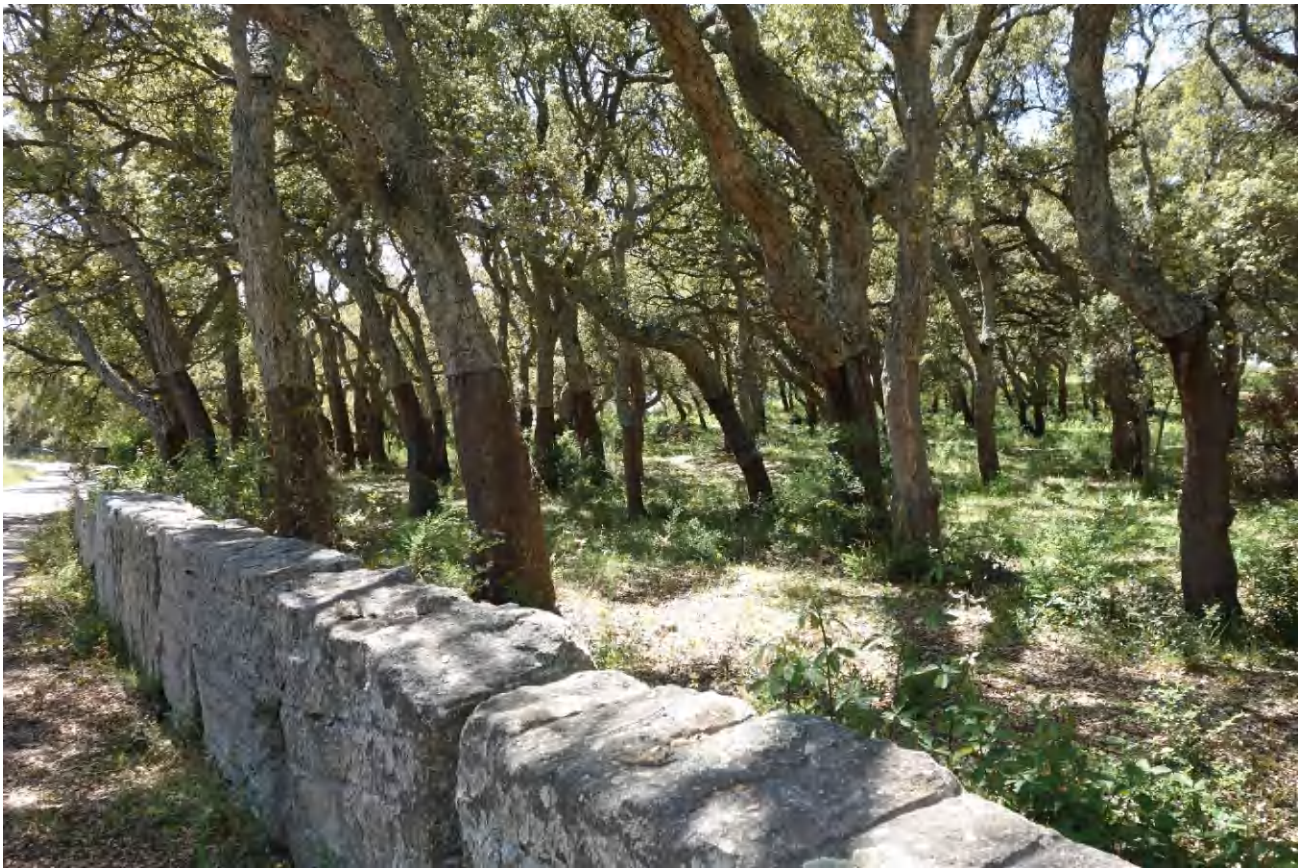
Vorbei an unzähligen Korkwäldern