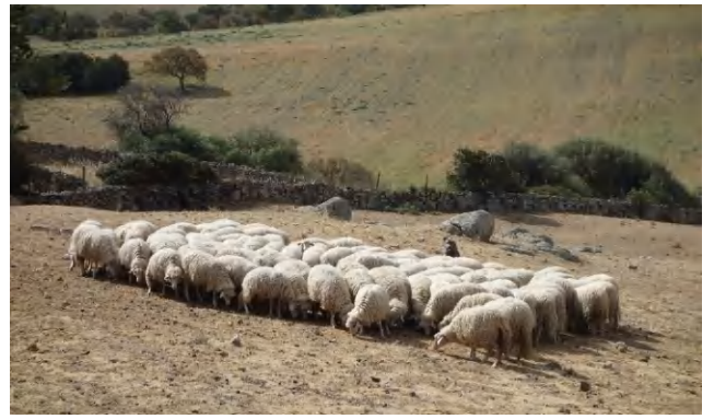
Schafe bewacht von einem Hirtenhund