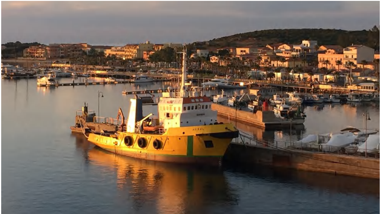
Sicht von der Fähre auf den Golfo Aranci