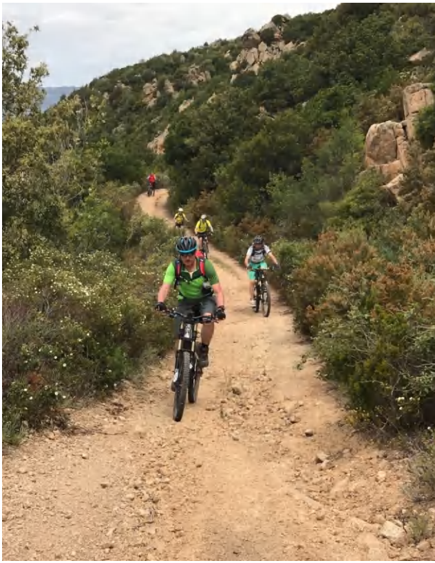
Super Weg bei warmen Temperaturen