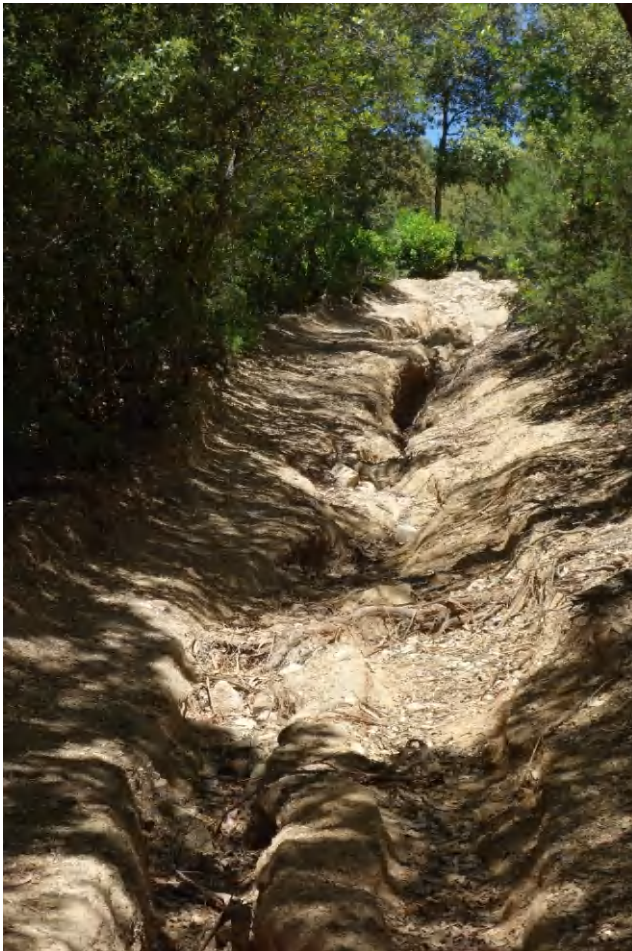
Ausgewaschene Wege, nicht immer befahrbar