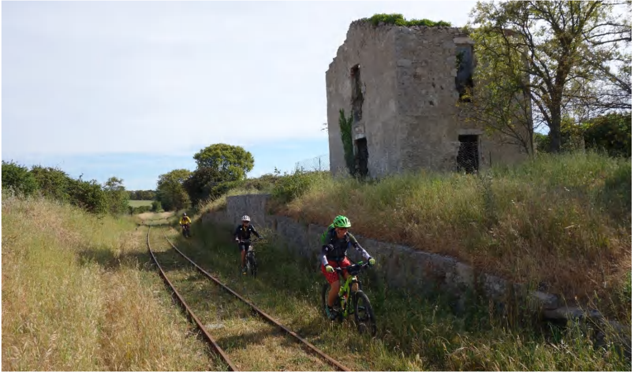
Selten benutzte Bahnlinie ergibt einen tollen Weg mit dem Bike.

Hindernisse sind da, um von Bikern überwunden zu werden.