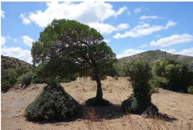
Vom Wind geformt