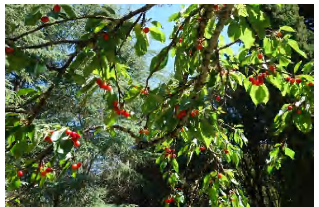
Kirschen wie im Baselbiet