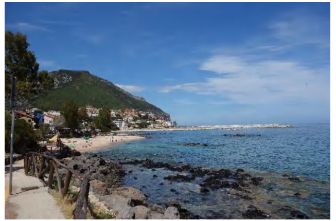
Typischer Küstenabschnitt bei Cala Gonone