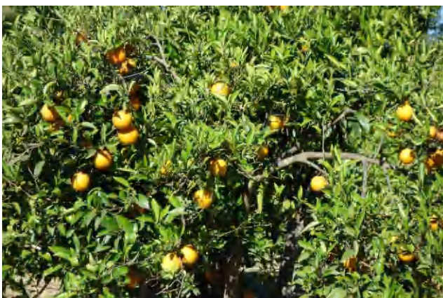
Orangen die offiziell gepflückt werden durften, mhhh weisch wiä guät