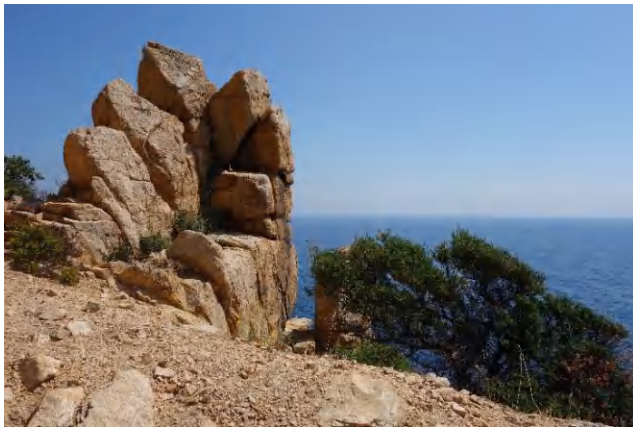
Eine häufige Gesteinsformation