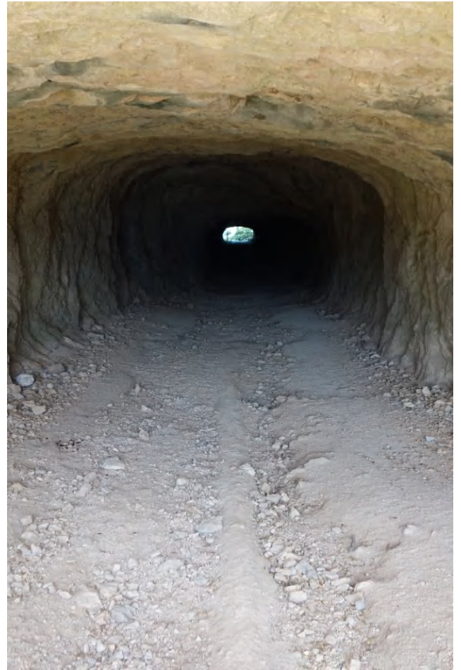
Ein alter Strassentunnel bei Dorgali. Mit dem Bike kann man hier durchfahren