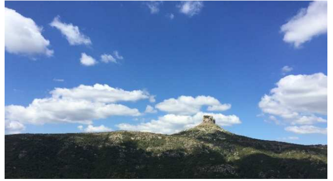
Markanter Fels bei Gairo