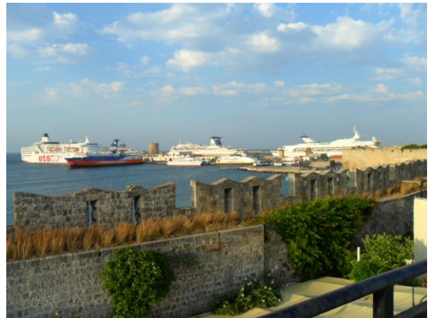
Hafen von Rhodos Stadt