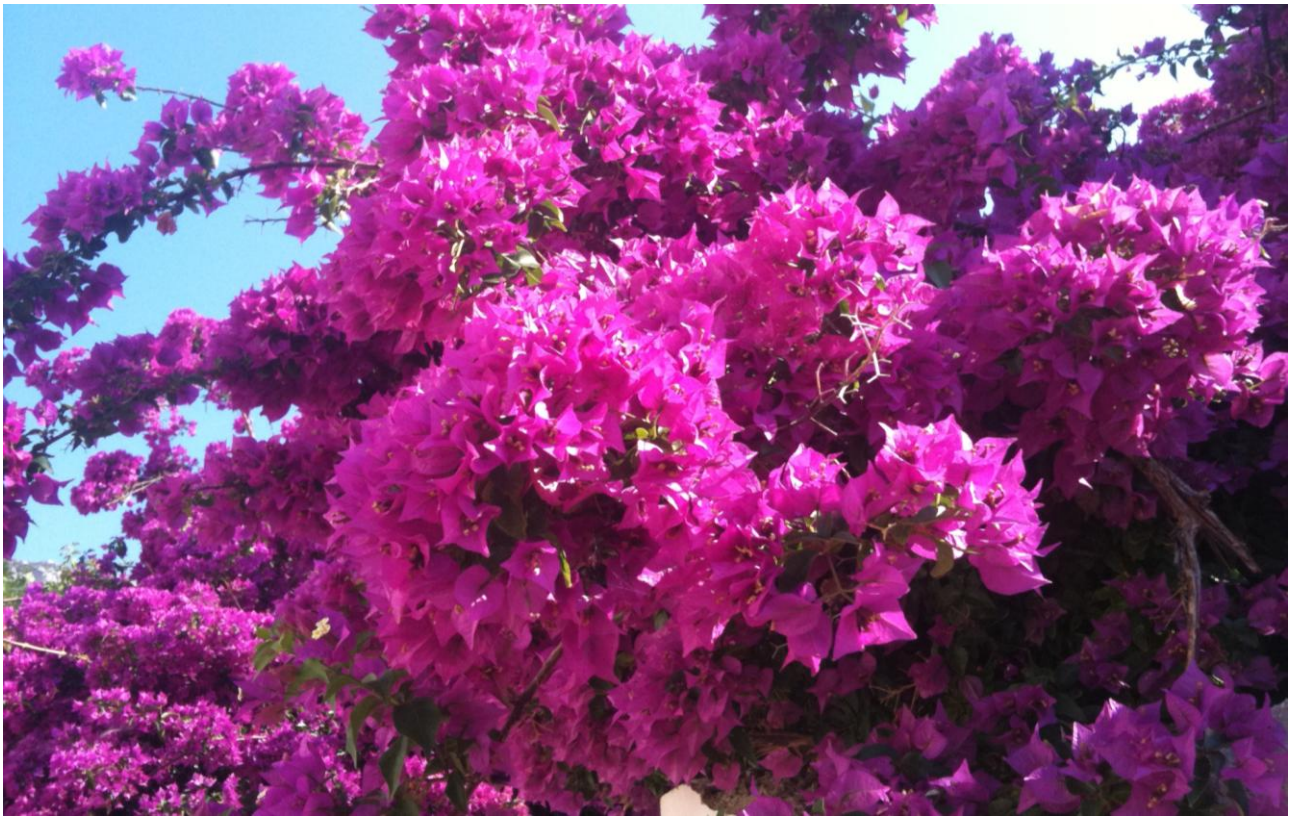
Die berühmten Bougainvilleas