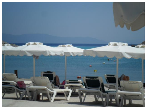
Strand von Mastichari auf der Insel Kos