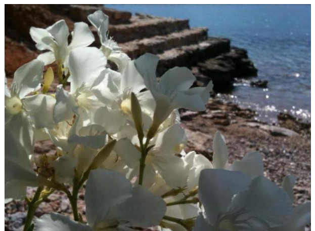
Weisser Hibiskus auf der Insel Tilos