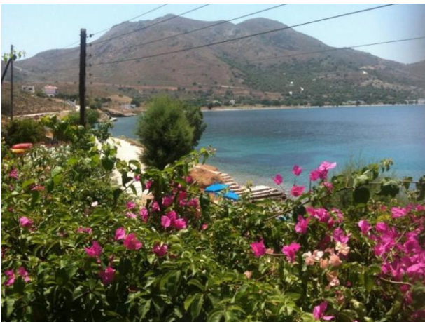
Strand von Livadia auf der Insel Tilos