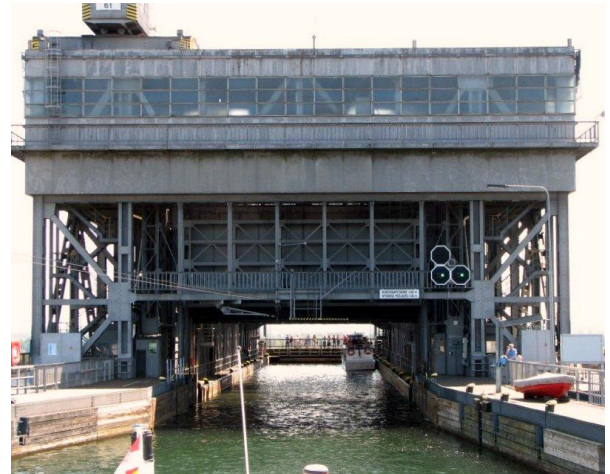
Einfahrt in den Trog.

Wir waren im Juli 2013 am und im Schiffshebewerk in Niederfinow, etwa 80 Kilometer nord-östlich von Berlin, am östlichen Ende des Oder-Havel-Kanals. In einer gut einstündigen Rundfahrt fährt man mit einem Schiff vom Unterhafen in den Trog des Schiffshebewerkes, wird nach oben gehoben, fährt ein kleines Stück zum Oberhafen hinaus und dann wieder hinunter zum Ausgangspunkt.