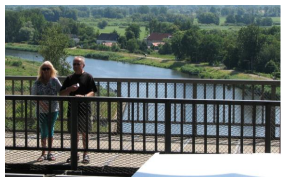
Der Trog ist oben, Blick auf die Fussgänger-Tribüne und den Unterhafen.