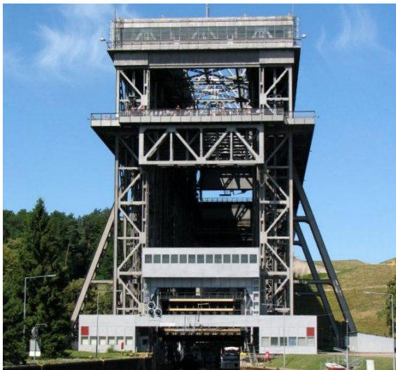
Einfahrt in den Trog vom Unterhafen.