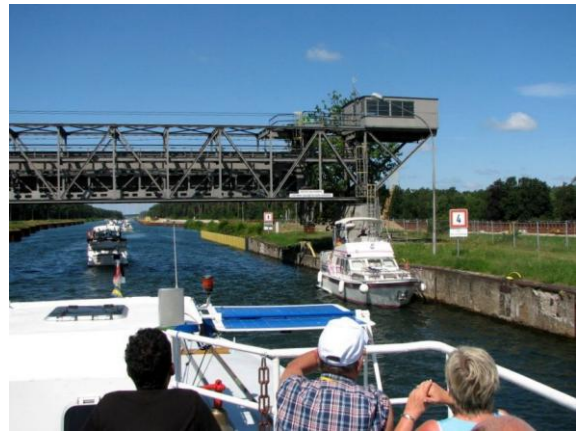
Ausfahrt in den Oberhafen mit der Sperranlage für den Oberlauf des Kanals, falls das Hebewerk massiv „undicht“ wird.