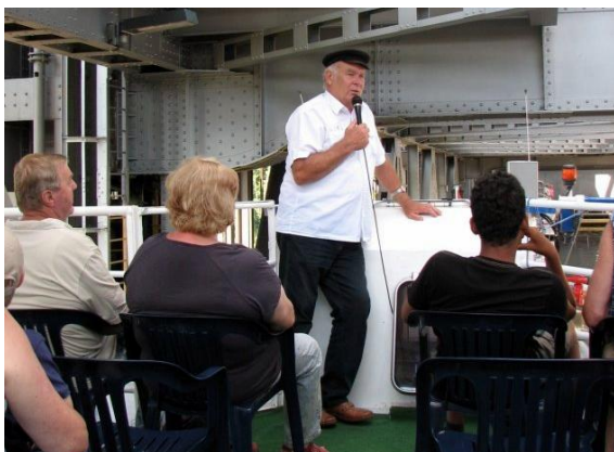
Der Kapitän gibt Erläuterungen, während der Trog aufwärts schwebt.