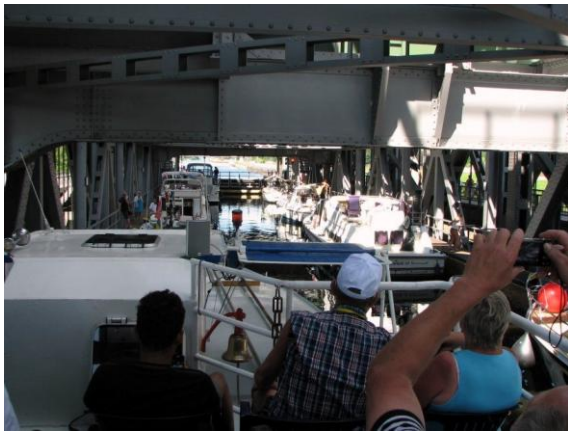
Nur noch ein paar Augenblicke bis zur Ausfahrt in den Oberhafen.