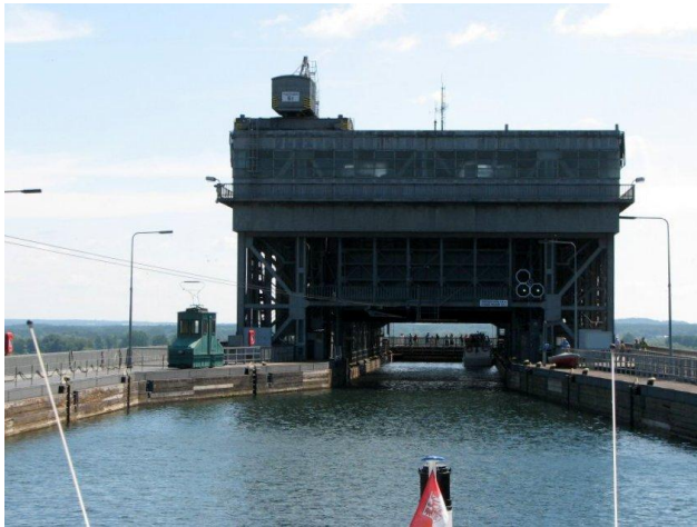
Einfahrt in den Trog vom Oberhafen. Links im Bild die Elektro-Lok, die früher die antriebslosen Schleppkähne zum Trog gezogen hat.