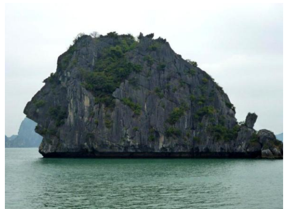
Da sah ich plötzlich einen Kopf im Felsen