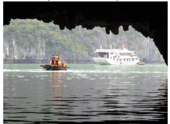
Die Bucht des herabsteigenden Drachens. In der Halong Bay in Vietnam.