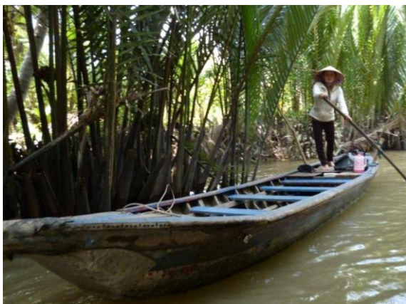
Bootsfahrt auf dem Mekong