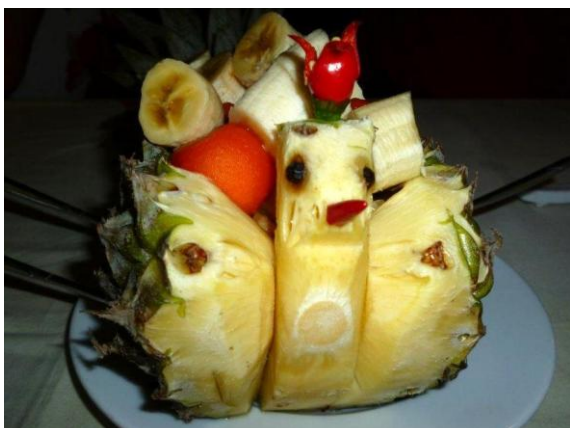
Ein Kunstwerk zum Essen