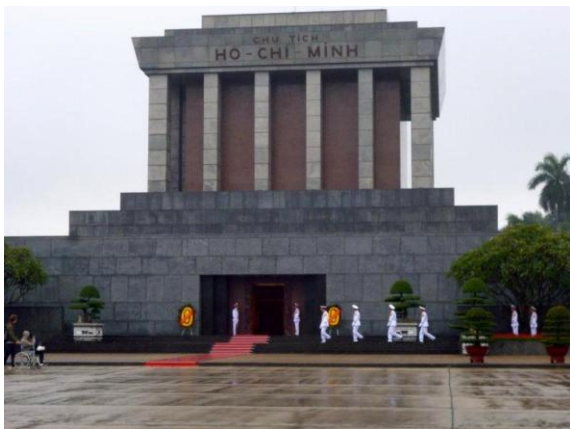
Das Mausoleum von Ho Chi Minh in Hanoi

http://www.computeria-olten.ch/archiv.htm