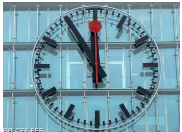
Fünf vor zwölf, aber in Aarau