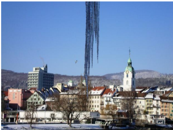
Eiszeit in Olten

http://www.computeria-olten.ch/foto_des_monats.htm