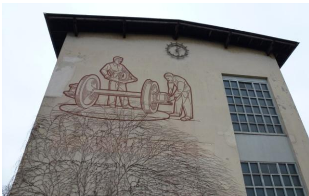
Tempi passati (SBB - Werkstatt Olten)