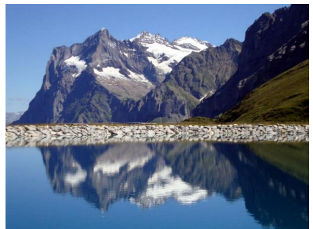
Bergsee unterhalb der Jungfrau