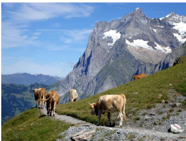
Auch die Kühe geniessen die Aussicht auf dem Eigertrail