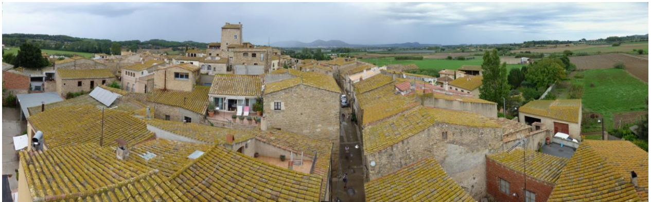
Palau-Sator ; das Dorf mit den gelben Dächern