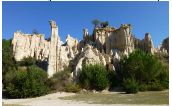
Les Orgues in Ille-sur-Têt sind von der Natur gemauert; Sandsteinfelsen, die sich ständig verändern.