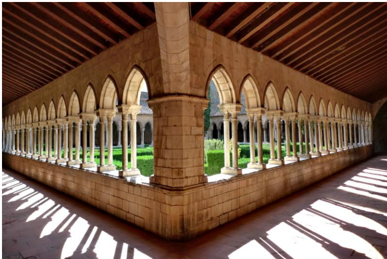
Kreuzgang der Benediktinerabtei in Arles-sur-Tech , aus weissem Céret-Marmor gebaut.