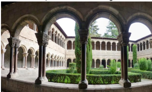
Ripoll ; Das Benediktinerkloster von Ripoll mit doppelstöckigem Kreuzgang.