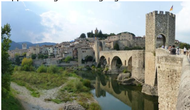
Besalu ; Das Wahrzeichen von Besalu ist die 105m lange verwinkelte Brücke über den Fluss Fluvià.