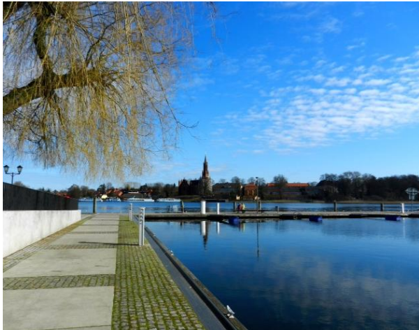
Seepromenade in Malchow